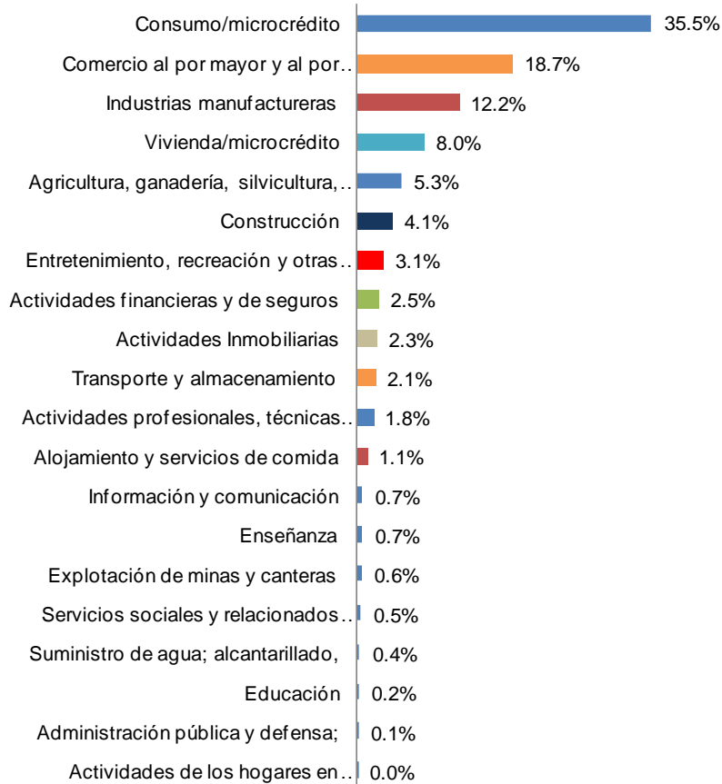
Gráfico 2.2.a Participación de los sectores en la cartera de Bancos Privados Diciembre 2014

cuadro 2.2.a muestra la composición de la cartera de bancos asignada a los diferentes sectores en el mes de diciembre 2014.